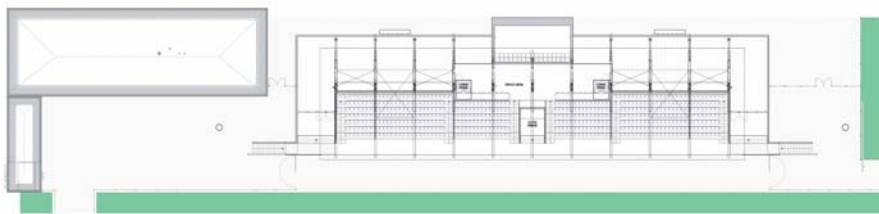
Plan du 1er étage

L'ensemble du projet va donc à la rencontre d'un programme exigeant sous plusieurs aspects, intégration, architecture, réserve d'évolution, image marquante et satisfaction aux attentes sportives aussi bien que politiques.